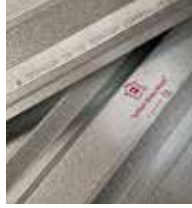
Ternium Zintro Alum®