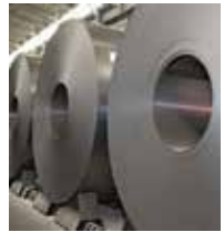
Ternium Rolado en Caliente y Rolado en Frío®