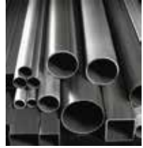
Ternium Tubería y Perfiles®