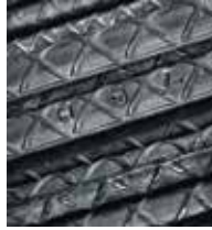
Ternium Varilla y Alambrón®