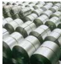
Lámina rolada en caliente y frío