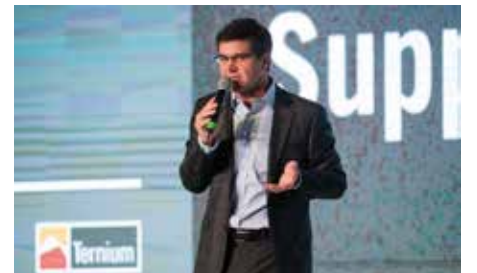
Máximo Vedoya. CEO Ternium

otorga con base en la trayectoria y los proyectos de las empresas, dentro de las líneas de acción del programa ProPymes de Ternium, como: asistencia industrial, financiera, comercial, institucional y capacitación a todos los niveles (mandos medios / operarios).